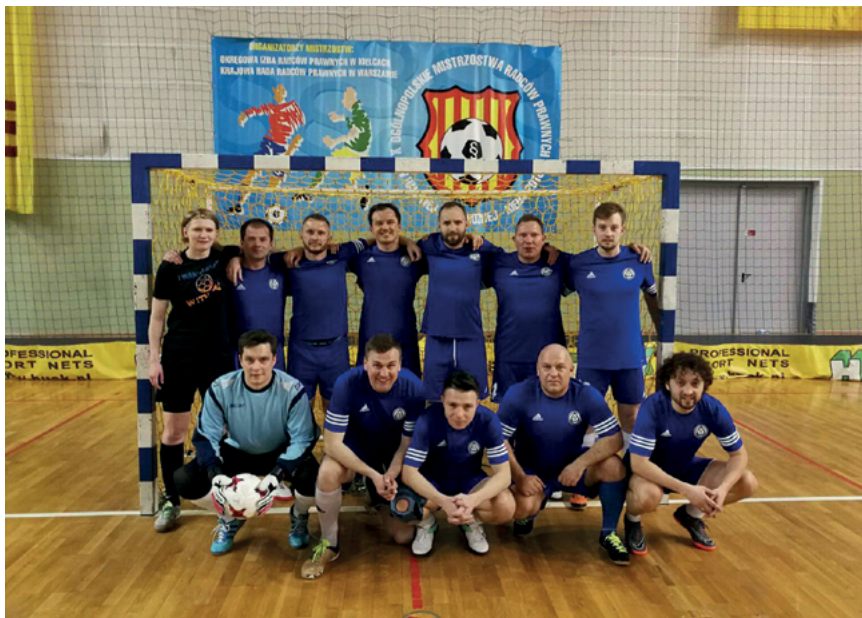
Drużyna OIRP Wrocław

P o 6 latach oczekiwania drużyna piłkarska OIRP Wrocław powróciła na najwyższe podium w rozgrywanych corocznie w Kielcach Ogólnopolskich Mistrzostwach Radców Prawnych w Halowej Piłce Nożnej.