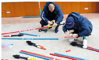
Szybka wymiana tyczek i można wracać na trasę

W trakcie pobytu członkowie naszej sekcji uczyli się jeździć, szkolili i doskonalili umiejętności w slalomie oraz slalomie gigancie. Podzieleni na grupy trenowali na trasach o różnych poziomach trudności, a same przejazdy filmowali trenerzy. Dzięki temu, podczas wieczornej wideoanalizy każdy mógł zobaczyć swój przejazd i wysłuchać uwag fachowca. Nasi zawodnicy dawali z siebie wszystko, nie szczczędząc sił i sprzętu.