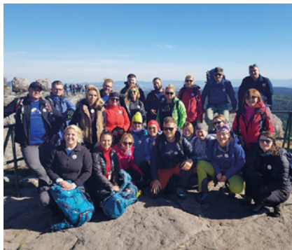
Fot. Sekcja Górská RPGóry przy OIRP we Wrocławiu

Pochmurno, wiatr umiarkowy z kierunku zachodniego. Temperatura o poranku bliska zera. Dzień Chłopaka. Imieniny obchodzą m.in. Imiślaw, Znamir, Ursus [niestety, nie było żadnego wśród nas]. Wieczorem polskich siatkarzy czeka wielki finał z Brazylią.