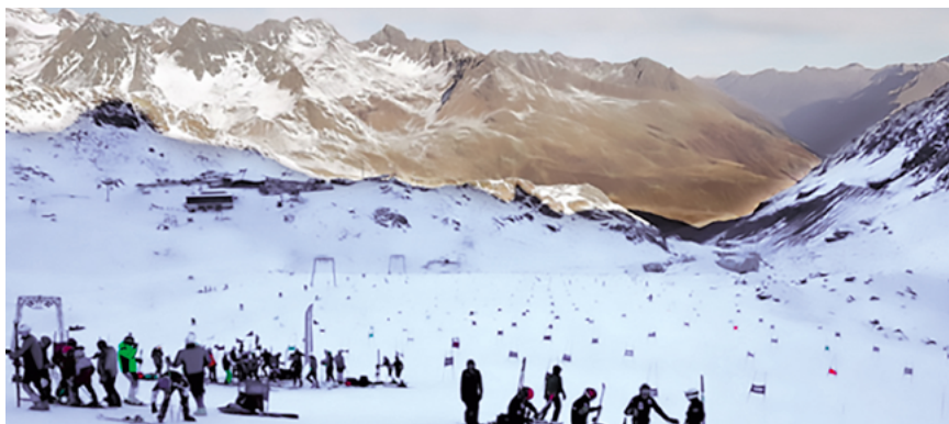
Dlatego czasami jeden slalom to za mało

Zapraszamy do sekcji wszystkich chętnych – zarówno tych, którzy chcą rozwinąć swoje umiejętności narciarskie i spróbować jazdy sportowej, jak i nieco bardziej doświadczonych narciarzy, którzy już mieli styczność z tyczkami. W planach wspólne wyjazdy narciarskie, treningi i porady fachowców. ●