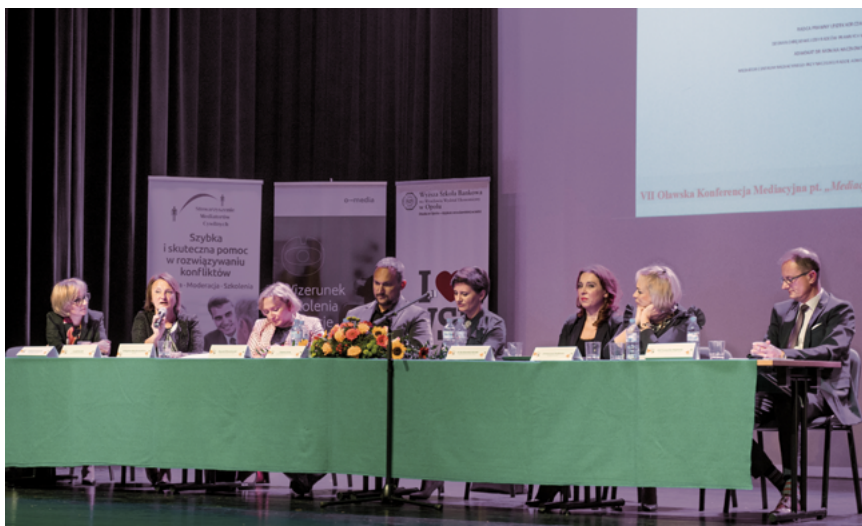
Fot. Krystian Mularczyk

Grażyna Górską, mediator Krystian Mularczyk, radca prawny