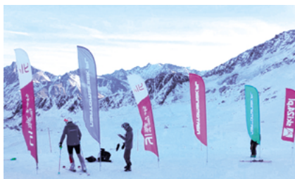
Tras do wyboru do koloru