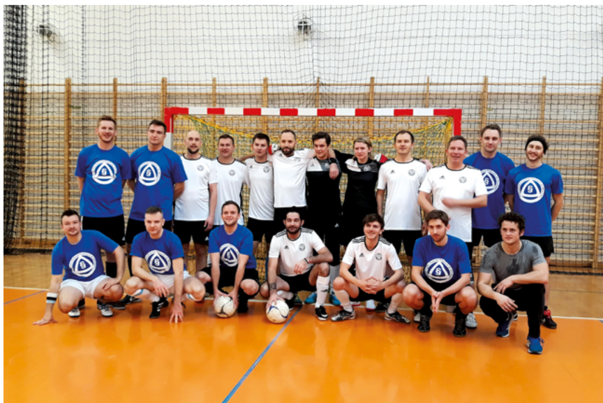
Drużyna OIRP we Wrocławiu oraz Drużyna aplikantów OIRP we Wrocławiu; fot. OIRP we Wrocławiu

25 listopada 2018 r. w Hali Sportowo-Widowiskowej w Kobierzycach odbył się II Halowy Turniej Piłki Nożnej o Puchar Dziekana Okręgowej Izby Radców Prawnych we Wrocławiu zorganizowany przez Sekcję Piłki Nożnej OIRP we Wrocławiu oraz Komisję ds. Promocji Zawodu i Integracji Środowiska.