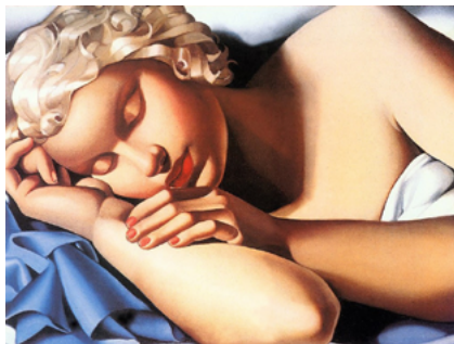
Tamara Łempicka, Sleeping Woman (Kizette)

Tamara Łempicka na jakiś czas porzuciła malowanie i jeszcze bardziej pochłonął ją wir życia towarzyskiego.