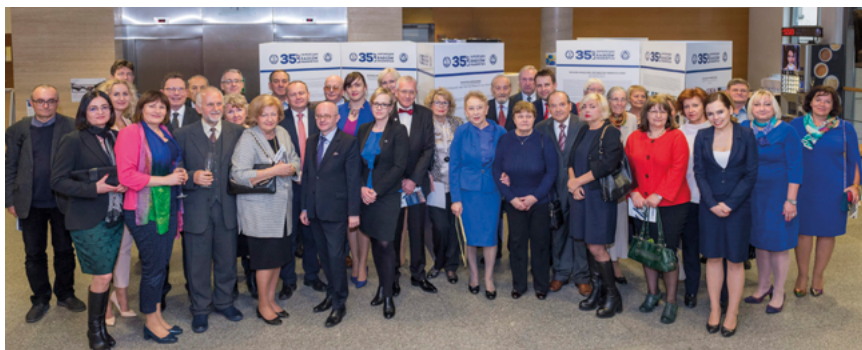
Goście przybili na wystawę z okazji 35-lecia istnienia samorządu radców prawnych we Wrocławiu; fot. Łukasz Giza

publikacja okolicznościowa, tj. album „Czasy i Ludzie. Rys historyczny Okręgowej Izby Radców Prawnych we Wrocławiu. Lata 1982–2012”. Album ten został wręczony uczestnikom uroczystości. Jest on dotąd jedynym, niezastąpionym kompendium wiedzy o tamtych czasach.