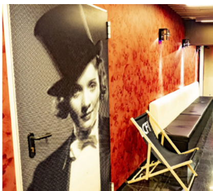
Wnętrze DCF

Przedmiotem zawartego porozumienia jest podjęcie wspólnych działań polegających m.in. na zapewnieniu dostępu do pomieszczeń DCF na potrzeby wydarzeń organizowanych lub współorganizowanych przez Okręgową Izbę Radców Prawnych we Wrocławiu, a także przyznanie członkom i pracownikom Okręgowej Izby Radców Prawnych we Wrocławiu promocyjnej ceny na zakup KART KINOMANA kina DCF w cenie 10 zł. Karta upoważnia do zakupu biletów na wszystkie filmy repertuarowe, premierowe oraz cykl Magiel