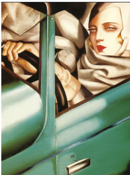
Tamara Łempicka, My Portrait (Self-Portrait in the Green Bugatti)