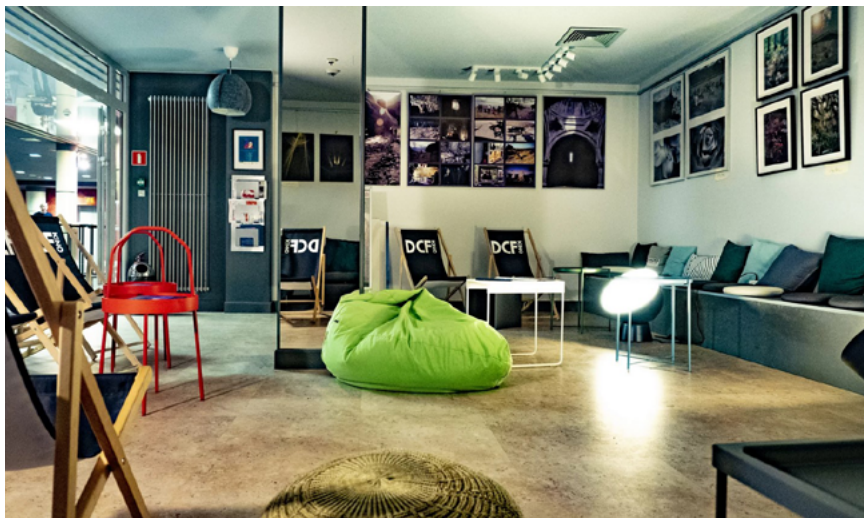
Wnętrze DCF

Informacje o wspólnych przedsięwzięciach będą zamieszczane na bieżąco na stronie OIRP we Wrocławiu oraz za pośrednictwem mediów społecznościowych. Zachęcamy także do śledzenia strony internetowej Dolnośląskiego Centrum Filmowego oraz mediów społecznościowych i do brania udziału w organizowanych i współorganizowanych przez nią wydarzeniach. Evviva l'arte! ●