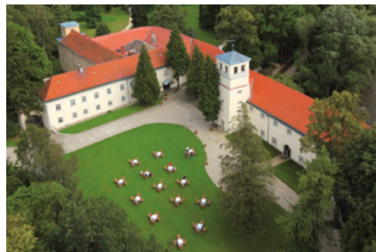
Hotel Zamek na Skale w Trzebieszowicach