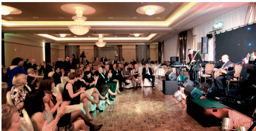
Obchody jubileuszu 30-lecia powstania Samorządu Radców Prawnych w OIRP we Wrocławiu

Prawdziwie huczne świętowanie jubileuszu odbyło się z okazji 30-lecia. Rozmach i urozmaicone formy uczczenia tej uroczystości, jak też liczny udział w obchodach członków Izby, wynagrodził poprzednie „lata posuchy”. Uroczystości odbyły się w dniach 5–6 października 2012 r. Rozpoczęły się wielkim bale w hotelu Haston, do tańca grał zespół „De Colt” z Krakowa, a miłym przerywnikiem zabawy był koncert Aloszy Awdiejewa. Niezapomnianą atrakcją był ogromny tort, w kształcie budynku naszej siedziby, który uroczystie i sprawiedliwie kroić Pani Dziekan. Druga, oficjalna część obchodów, rozpoczęła się kolejnego dnia w Auli Leopoldina z licznym udziałem przedstawicieli lokalnych władz, świata naukowego, a także sądów, prokuratury i samorządu adwokackiego. Obecni byli Prezes i wszyscy Wiceprezisi KRRP. Podczas gali zostały wręczone honorowe odznaczenia samorządowe i pamiątkowe medale. Była też przedstawiona prezentacja multimedialna, ukazująca ważne wydarzenia z życia Izby oraz wystawa ukazująca budynek Izby przed i po remoncie. Wydana też została